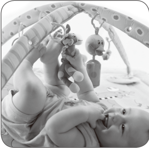
※写真は旧タイプのアーチを使用しています